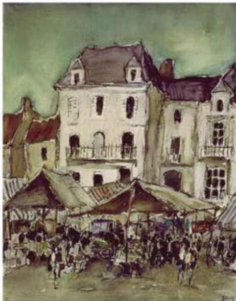
Jour de marché à Vitry, 1969 - Cat. # 2179

Espace dédié à l'oeuvre du peintre et aquarelliste belge Roger Gobron (1899-1985). Expositions, présentation de films sur la vie et l'oeuvre du peintre et de son épouse - la poétesse Marie-Jo Gobron (1916-2008), recueils de poèmes, monographie et catalogue raisonné du peintre, anthologies, livres et objets divers. Ouvert uniquement sur rendez-vous.